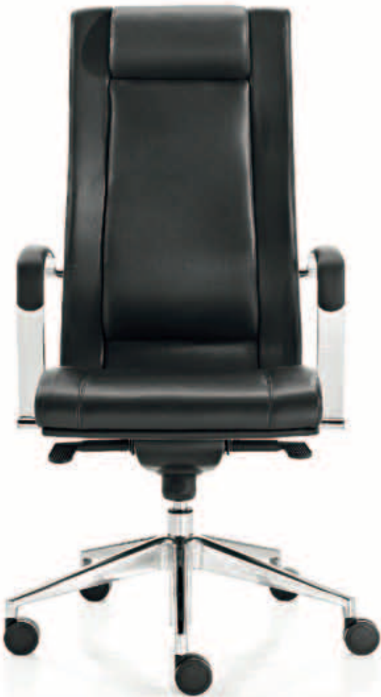
Trix managers' armchair ideal for high class offices, available with high and medium back and also as cantilever option. The swivel chairs are equipped with kneetilt mechanisms which are easy to use .