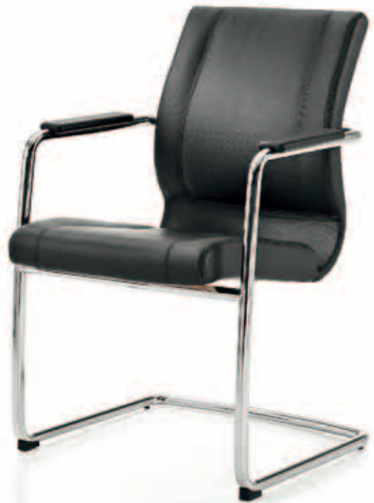
Trix fauteuil de direction existe en version haute, mi-haute et basse. Les versions tounantes sont pourvues d'un mécanisme basculant décalé qui permet un réglage parfait et une utilisation simple.